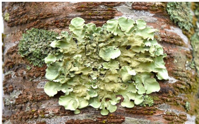
Figure 1 Habitat of thallus lichen P. tinctorum growth on bark.

การศึกษาเกี่ยวกับฤทธิ์ต้านอนุมูลอิสระจากไลเคนได้รับความสนใจจากนักวิจัยเนื่องจากมีสารไลเคนที่มีความแตกต่างจากสารที่สร้างโดยพืชอื่น ๆ พบการศึกษาในไลเคนกลุ่มฟรุติโคส (Fruticose) ชนิด Cladonia furcata และกลุ่มโฟลิโอส (Foliose) ได้แก่ Hypogymnia physodes , Lasallia pustulata , Parmelia caperata และ P. sulacata พบว่าไลเคนกลุ่มโฟลิโอสชนิด L. pustulata แสดงผลการต้านอนุมูลอิสระได้ดีที่สุดในสารสกัดด้วยอะซิโตน เมทานอล และน้ำ จากการทดสอบด้วยวิธี DPPH และสอดคล้องกับปริมาณสารประกอบฟีนอลิก และฟลาโวนอยด์ที่มีปริมาณมากในไลเคนชนิดที่มีฤทธิ์ต้านอนุมูลอิสระได้ดี (Kosanich et al., 2011) ไลเคนสกุล Parmotrema หลายชนิด เช่น P. pseudotinctorum , P. stippeum และ P. tinctorum สกัดด้วยเมทานอลพบว่าชนิดที่มีร้อยละการยับยั้งสูงสุด คือ P. pseudotinctorum (Fernandez-Moriano et al., 2016) จากข้อมูลดังกล่าวมาข้างต้นเกี่ยวกับการใช้ประโยชน์จากไลเคนในประเทศต่าง ๆ และหลากหลายวิธีการใช้ เช่น ใช้ผสมในอาหาร ใช้เป็นเครื่องสำอางประเภททาทำให้ไลเคนมีศักยภาพที่น่าสนใจสำหรับการพัฒนานำไปใช้ประโยชน์ในอนาคตได้ ดังนั้นการวิจัยครั้งนี้มีวัตถุประสงค์เพื่อประเมินฤทธิ์ต้านอนุมูลอิสระและวิเคราะห์หาปริมาณสารประกอบฟีนอลิกรวมของโฟลิโอสไลเคนชนิด P. tinctorum ที่ทำการสกัดด้วยการหมักกับเมทานอล อะซิโตน และเอทิลอะซิเตทที่อุณหภูมิห้อง ทดสอบฤทธิ์ต้านอนุมูลอิสระด้วยวิธี 2,2-diphenyl-1-picrylhydrazyl (DPPH) และ Ferric reducing antioxidant power (FRAP) และวิเคราะห์ปริมาณสารประกอบฟีนอลิกรวมด้วยวิธี Folin-Ciocalteu phenol เพื่อเป็นข้อมูลพื้นฐานในการใช้ประโยชน์จากไลเคนกลุ่มโฟลิโอสต่อไปในอนาคต